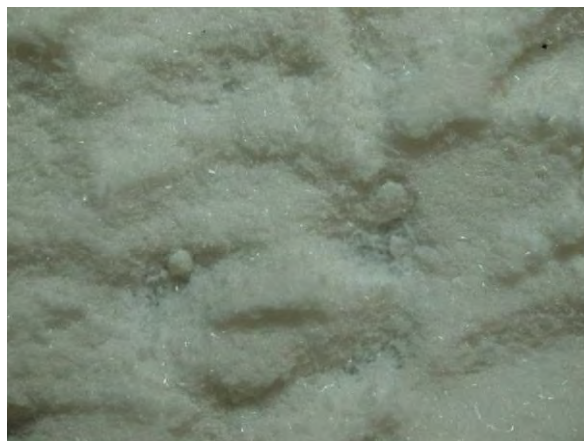
▲ オキサミド(1), 実体顕微鏡(10倍)