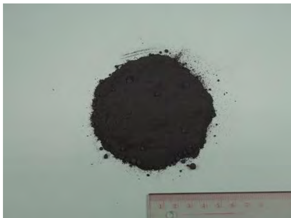
▲ 石灰窒素(1), 現物