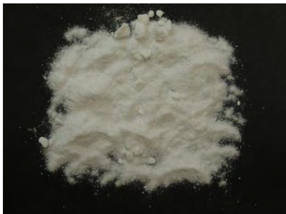
▲ オキサミド(1), 現物 白色の結晶で吸湿性はない。