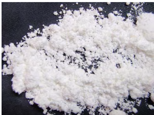
▲ 硫酸グアニル尿素(1), 現物