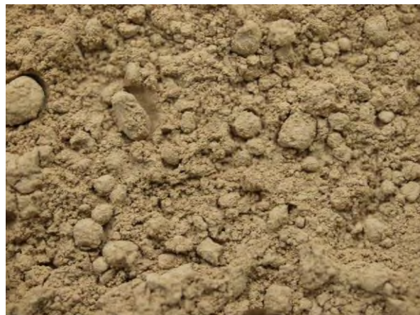
▲ クレー(1), 実体顕微鏡(10倍)