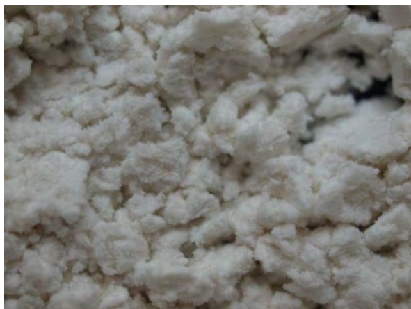
▲ パーライト(1), 実体顕微鏡(10倍)