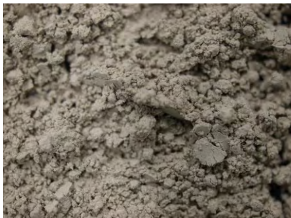
▲ けいそう土(1), 実体顕微鏡(10倍)