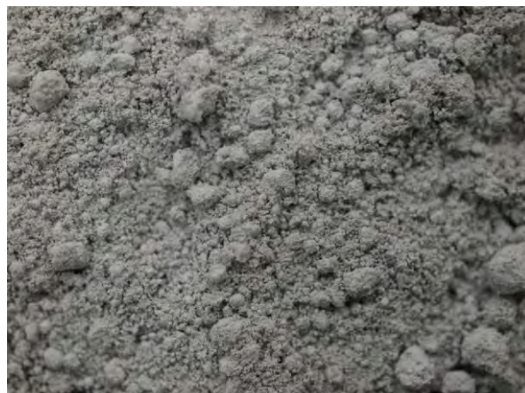
▲ シリカヒューム(1), 実体顕微鏡(10倍)