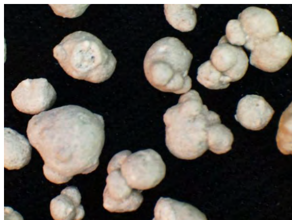
▲ 過りん酸石灰(1), 実体顕微鏡(10倍)