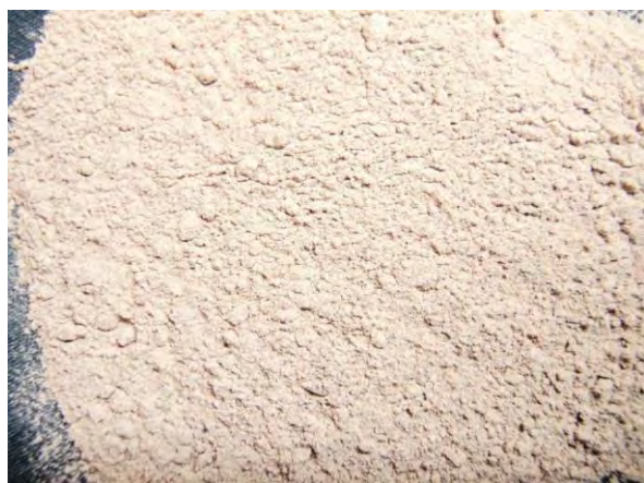
▲ 焼成りん肥(1), 現物