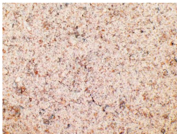
▲ 焼成りん肥(1), 実体顕微鏡(10倍)