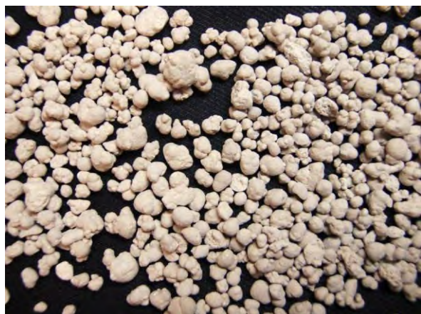
▲ 過りん酸石灰(1), 現物 灰色の粉末又は粒状のものが多く。