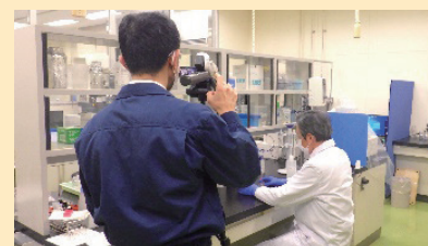
撮影など、動画制作はFAMIC職員が担当