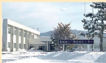
北海道立工業技術センター